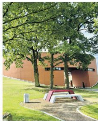
Foto oben: Firmeninhaber Jochen Benkert (links) und Schreinermeister Uli Weißenseel sind stolz auf das, was die Firma in im kleinen Königsberger Ortsteil geschaffen hat. Im futuristischen Firmengebäude (Bild links), entworfen vom Architekten Mario Botta, entstehen designorientierte Sitzmöbel wie die Serie Chalidor 700 (Foto unten)