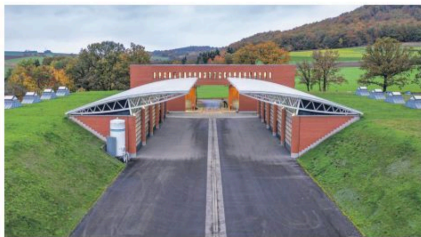
Eingebettet ins Grün: das Firmengebäude von Benkert.